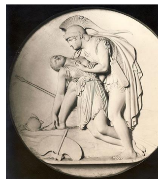
Σχῆμα 3. Αχιλλέας και Πενθεσίλεια. Πηγή

Ἔτσι αφού εἶπε τράβηξε τὸ δόρυ ὁ Πηλεΐδης ἀπ' τὸ γοργόδρομο ἄλογο και τὴν ἔρμη Πενθεσίλεια· 655 σπάραζαν κ' οἱ δυὸ ἀπ' τὸ ἴδιο δόρυ δαμασμένοι. Εκείνος πήρε ἀπὸ τὸ κεφάλι τῆς τ' ἀστραφερό τῆς κράνος, που με ἠλιαχτίδες ὁμοίαζεν ἢ μ' ἀστροπή του Δία· κι ἐκείνης ἀν και βρισκουνταν στη σκόνῃ και στο λύθρο κάτω ἀπ' τὰ πυκνά τῆς φρύδια ξάστραφτεν ἡ ὁμορφιά τῆς 660 κι ἂς ἦταν πεθαμένη. Οἱ Δαναοὶ γύρω τῆς μαζεμένοι θωρώντας τὴν εθάμαζαν, τι ἔμοιαζε θεά μακάρια. Κοίτουσαν ἀρματωμένη χάμου ὁμοία με τὴν κόρη τὴν ἀδάμαστη του Δία, τὴν Ἄρτεμη, ὅταν ὕπνος τὴν πάρει αφού ἀπόκαμεν στα ψηλά βουνά λιοντάρια 665 να χτυπᾶ· γιατί ἐκείνην, ἀν και πεθαμένη τόσο ὁμορφῆ ἡ καλοστέφανη Κύπρη του ἰσχυροῦ του Ἄρη ἡ σύζυγος τὴν παρούσιασε, που να λυγίσει ἀντρα τον ἀλύγιστο Πηλεΐδη. Σε γυναίκα τέτοιας κλίτην εὐχουνταν πολλοὶ Δαναοὶ στο σπῆτι τὸς γυρνώντας, 670 ν' ἀναπαύονται. Ὁ Πηλεΐδης μετανογώντας τώρα θλίβουνταν που τὴν ἔσφαξε και στὴν ἵπποθρόφα Φθία νύφη δεν ἔφερεν αὐτὴ τὴν ἀψεγή γυναίκα, που ἔμοιαζε ἀθάνατη θεά στο μπόι και στὴν ὄψη.